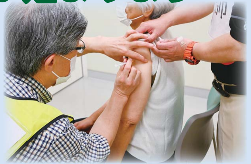
▲5月16日の集団接種の様子

かかりつけ医で予約が取れない方は、初診でも接種可能な医療機関がありますので、実施医療機関等一覧で確認の上、申し込みください。なお、接種券に同封した実施医療機関等一覧に一部変更があります。詳しくは2面をご覧ください。