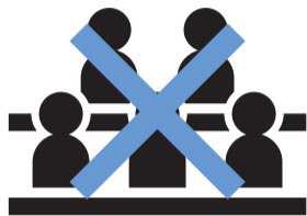
密を回避した行動