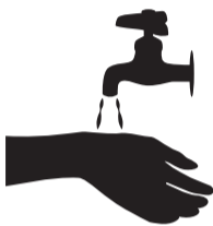
小まめな手洗い・消毒