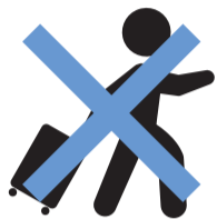
日中を含む不要不急の外出自粛

また、若い世代でも、重症化するケースや軽症であっても後遺症に悩まされるケースが報告されています。「自分が感染しない・周りの人へ感染させない」行動の徹底をお願いします。