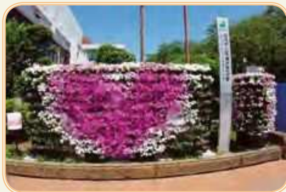
街並みを彩るフラワーメリーゴーランド(左)とフラワーキャンバス(右)