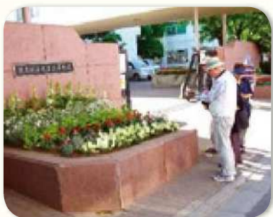
審査委員による審査の様子