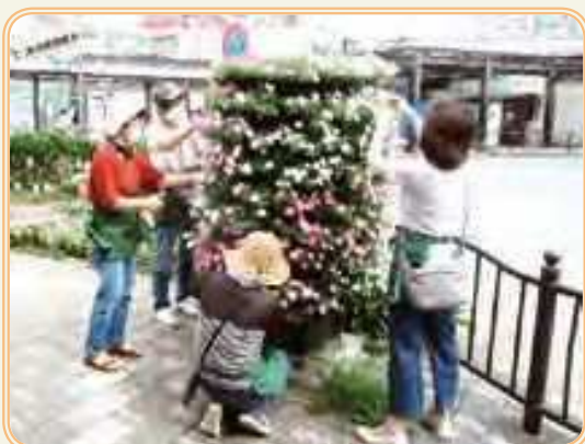
サポーターによる花の手入れの様子