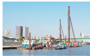
▲都による中川での耐震工事(地盤改良)の様子

中川や新中川、綾瀬川の堤防や水門などが大地震時にも機能するように、施設の補強や堤防付近の軟弱な地盤を強固に改良などの耐震対策を都と協力しながら進めています。これに合わせて、中川では、川に親しめる中川テラスの整備を進めており、現在、上平井橋から立石八丁目、高砂一丁目までの区間を公園として開放しています。 【担当課】 調整課 ☎03 - 5654 - 8373