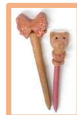
おがくず粘土工作 「えんぴつ作り」