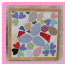
端材で作る モザイクタイル