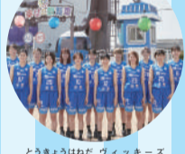
とうきょうはねだ ヴィッキーズ 東京羽田 VICKIES (女子バスケットボールクラブ)