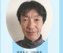
山本 恒安 (世界選手権元日本代表)