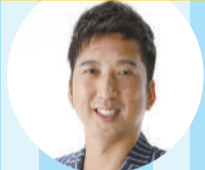
藤川 球児 (元阪神タイガース投手)