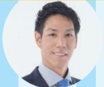
荒波 翔 (元横浜DeNAベイスターズ外野手)