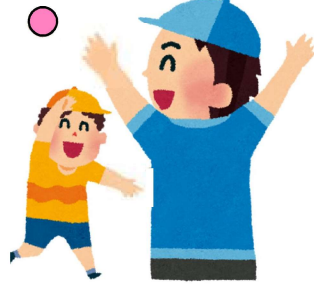
キャッチボール (ゴムボールまで)