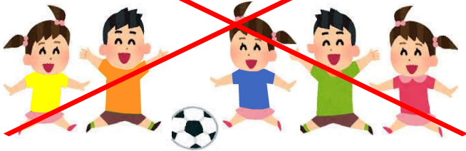
しあ いけいしき 試合形式でのボール遊び