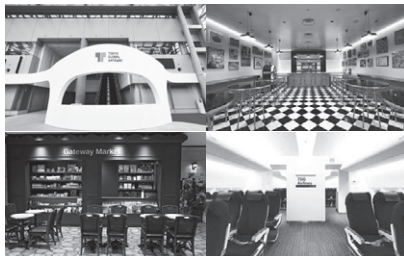
▲TOKYO GLOBAL GATEWAY(江東区青海)

※イングリッシュキャンプは、新型コロナウイルス感染症拡大の影響で令和2、3年度は中止