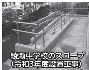
綾瀬中学校のスロープ (令和3年度設置工事)

令和4年度は、小学校9校・中学校4校に備品のスロープを購入するほか、小学校2校にバリアフリートイレを設置します。