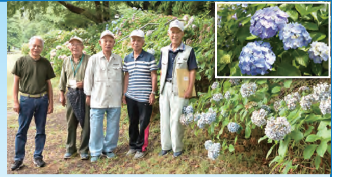
▲実行委員会の皆さん