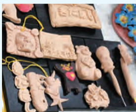
▲リサイクル木製粘土「もくねんさん」

創業71年の歴史を誇る鉛筆製造会社です。鉛筆だけではなく、製造工程に発生するおがくずをリサイクルした木製粘土や木彩画絵の具など、さまざまな製品を開発しています。木という自然素材によって、人にも環境にも優しい製品づくりをめざしています。こうした製品づくりを通して、SDGsへの貢献も意識しています。