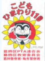
▲このプレートが目印です

【問い合わせ】 各区立小学校 【担当課】 地域教育課 ☎03-5654-8589