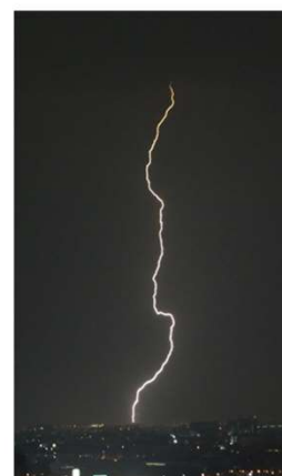
夜の落雷 (対地放電)

なお、雷によって屋外での活動やイベントを中断などした場合は、雷ナウキャストの予測を活用していただくと共に、“雷鳴が 30 分間聞こえない”ことを再開の目安としてください。