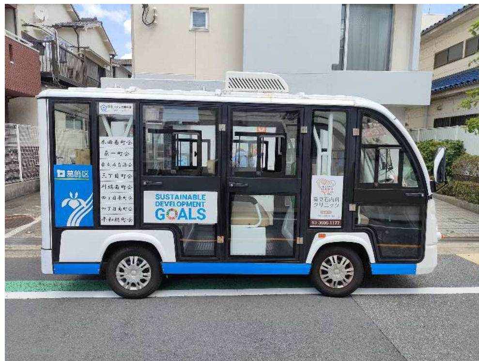
協賛社のステッカーをサイドガラスに掲示