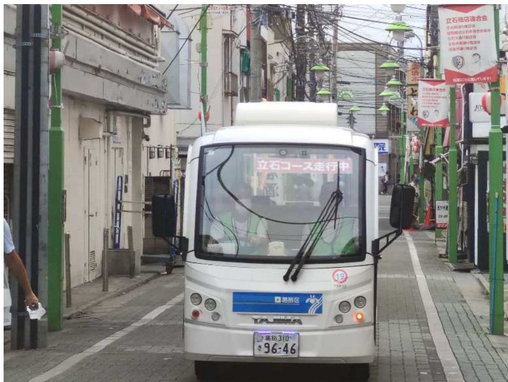
京成立石駅付近を走行中の様子