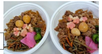
こども食堂のお弁当

フードパントリーは親に頼ることができない若者、または世帯年収が非課税基準+20万円程度未満の子育て家庭を対象としています。