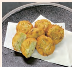
優秀賞 超かんたん! がんも麹