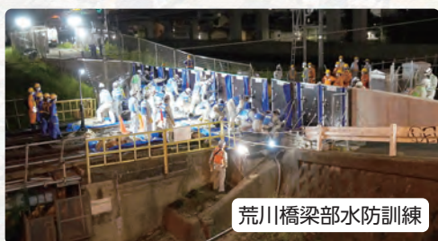
荒川橋梁部水防訓練