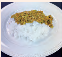
最優秀賞 ヘルシードライカレー