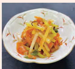
優秀賞 野菜の皮はりはり漬け