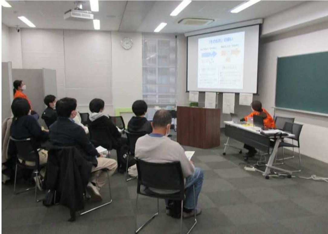
葛飾地区理大祭（東京理科大学の学園祭）（令和4年11月26日（土））