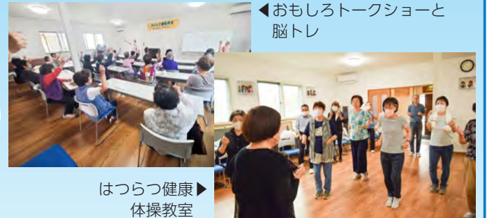
◀おもしろトークショーと脳トレ