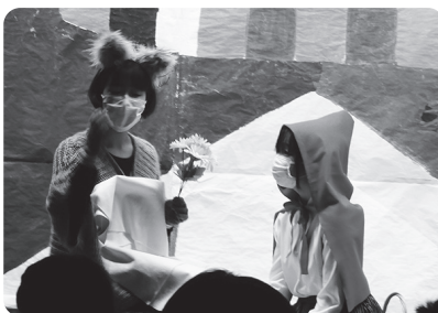
▲奥戸中学校(英語活動部)