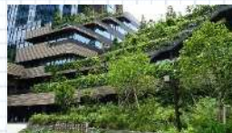
緑化された建物（コモレ四谷）