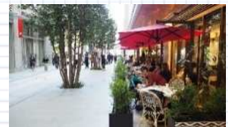
街路に面した飲食店（日本橋カリア）