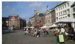
ヨーロッパの広場（コパルハーゲン）