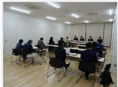
▲勉強会当日の様子