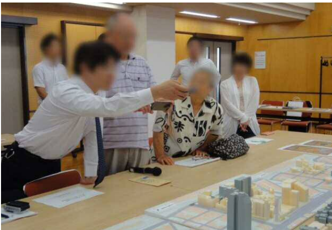
《下写真：意見交換の様子》