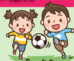
のびのびと育つ権利

愛情を持って育てられ、健康に配慮され、あらゆる差別を受けず、安心して生活できます。