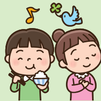
安心して生きる権利

愛情を持って育てられ、健康に配慮され、あらゆる差別を受けず、安心して生活できます。