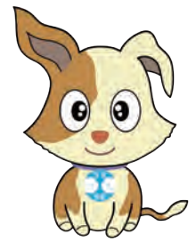
▲行政相談マスコットキクーン