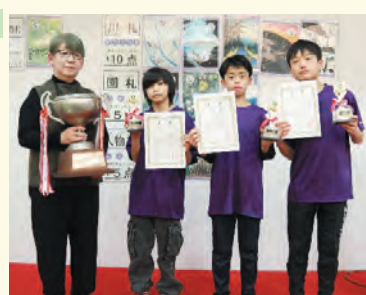
▲奥戸地区の皆さん