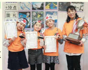
▲亀有地区の皆さん