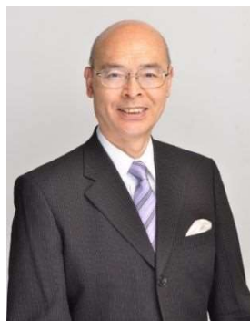
令和6（2024）年3月 葛飾区長 青木克徳

最後に、本計画の策定にあたり、多大なご協力をいただきました葛飾区高齢者虐待防止ネットワーク運営委員会の皆様、計画作業部会の皆様に厚く御礼申し上げます。