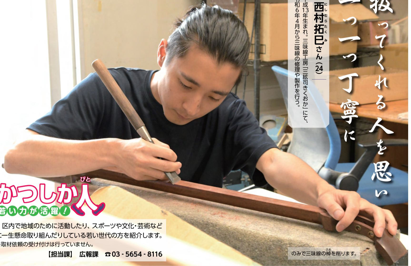
のみで三味線の棹を削ります。

平成13年生まれ。三味線工房「三絃司きくおか」にて、令和6年4月から三味線の修理や製作を行う。