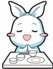
▲葛飾区ごみ減量・3R推進キャラクター リー(Ree)ちゃん