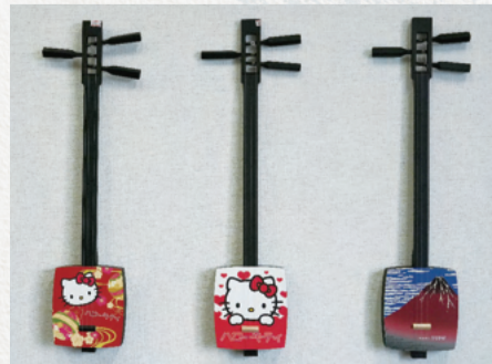
▲小じゃみチントン

また、小学校で三味線の授業を行い、演奏を聴いてもらったり、小じゃみチントンを弾いてもらったりしています。手軽な小じゃみチントンをきっかけに三味線のことを知ってもらい、少しでも興味を持ってくれたらうれしいです。