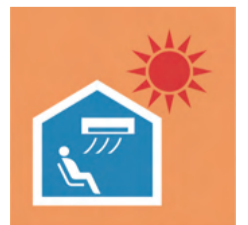
▲このマークが目印