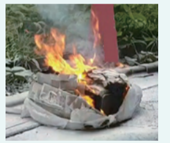
▲ごみ袋が発火した様子