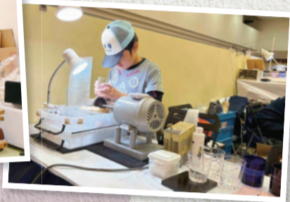
▲職人会まつりの様子