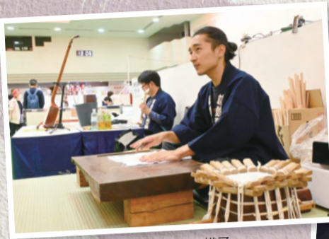
▲産業フェアの様子