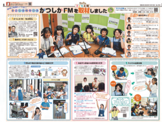
▲昨年度の子ども広報