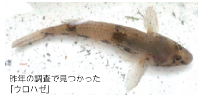
昨年調査で見つかった「ウロハゼ」